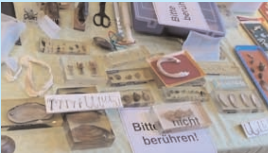
Kursvorbereitung - BGF -

Fischbiologie: - AFK - Exponate - Präparate uvm.