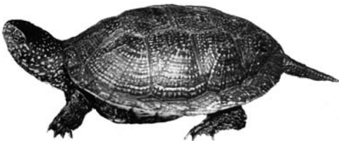
Sumpfschildkröte europ. Lt. BayNatSchG/NatEG, ganzjährig geschützt

Fotos, Entwurf, Satz: E. & G. Rauch © 9/11 - Druck: Offset Westphal - Weila Bildtechnik