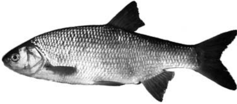
7.2 Frauennerfling 30 cm, 01. März - 30. Juni